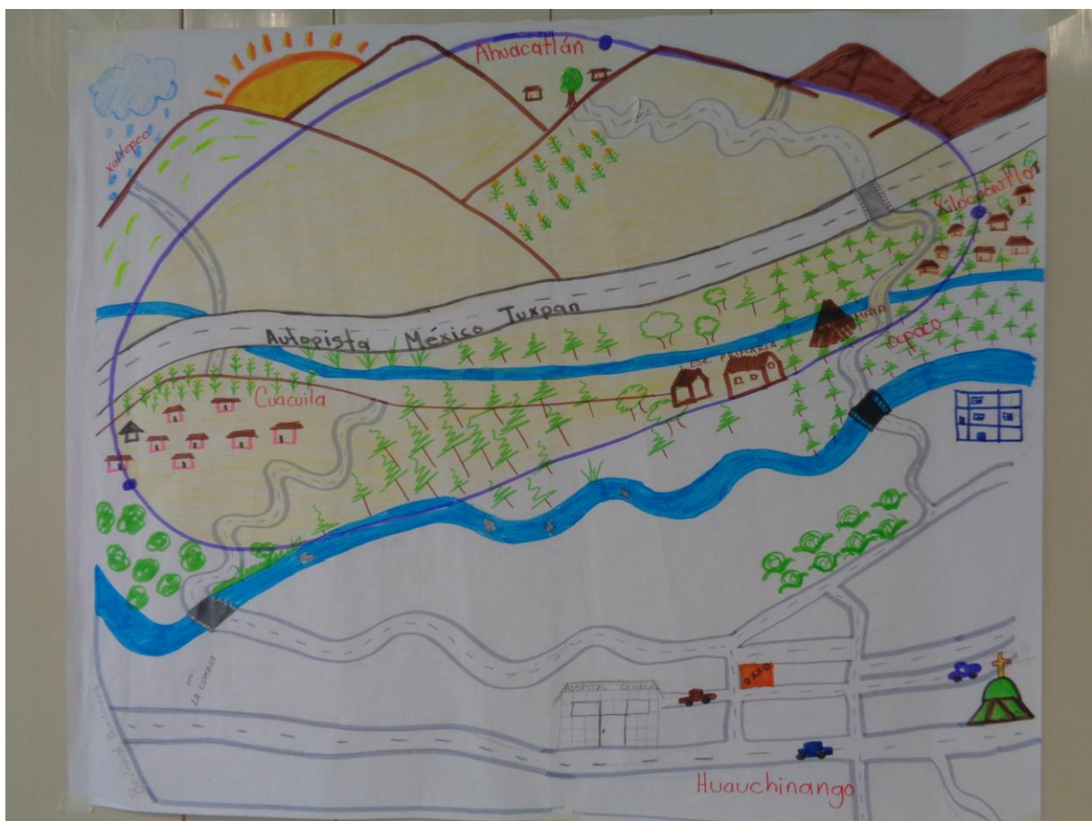
Fig. 1 Mapa de las comunidades nahuas analizadas