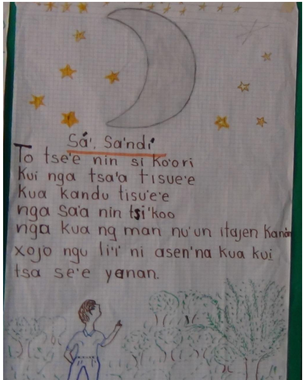
Fig. 2 Sá' sa'ndí "Luna lunita" (ponencia)

To tse'e nin si ko'ori kui nga tsa'a tise'e kua kandu tisu'e'e nga sa'a nin tsi'koo nga kua ng man nu'un itajen kanán xojo ngu lí'i' ni asen'na kua kuj tsa se'e yanan.