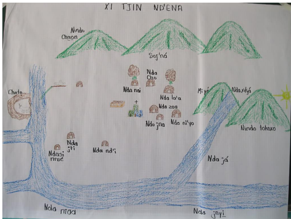
Fig. 1. Croquis de la comunidad de Huautla de Jiménez.

Xi fet'ani, kuati n'io kjin nd'e ñani bitjo nanda tse nga s'a tonga nd'ai je ticha nga je kjin nd'ia tjio satió kua je tjio baté ngayije yá xi tsua nanda joni: Nda nai, nda la'a, nda zoa, nda xikja, nda niyo, ndasi nrue, nda ja, nda jti, nda cho, nda jná, nda nd'i, nda jnyi, nda niaa nkjinsa ma ñani ma chjue nanda xi mayó ya nd'e tejaó tonga nga chondua xíní.