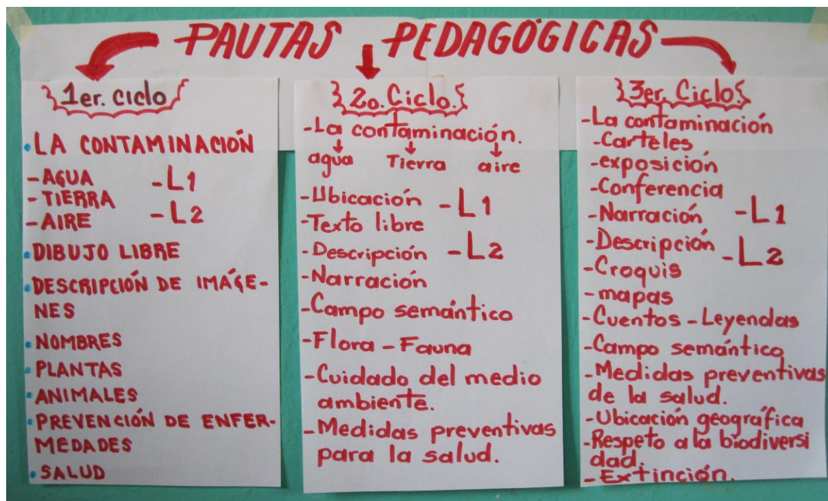
Fig. 5. Pautas pedagógicas: Je Niké