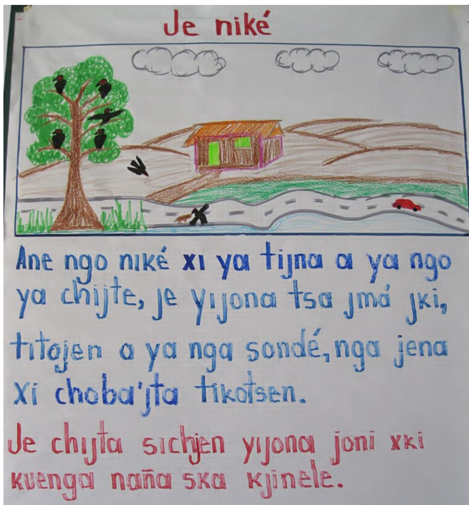
Fig. 1. Descripción de animales en presente de la 1ª, 2ª SG, y 1ª PL: Je Niké

Je chijta sichjen yijona joni xki kuenga naña ska kjinele.