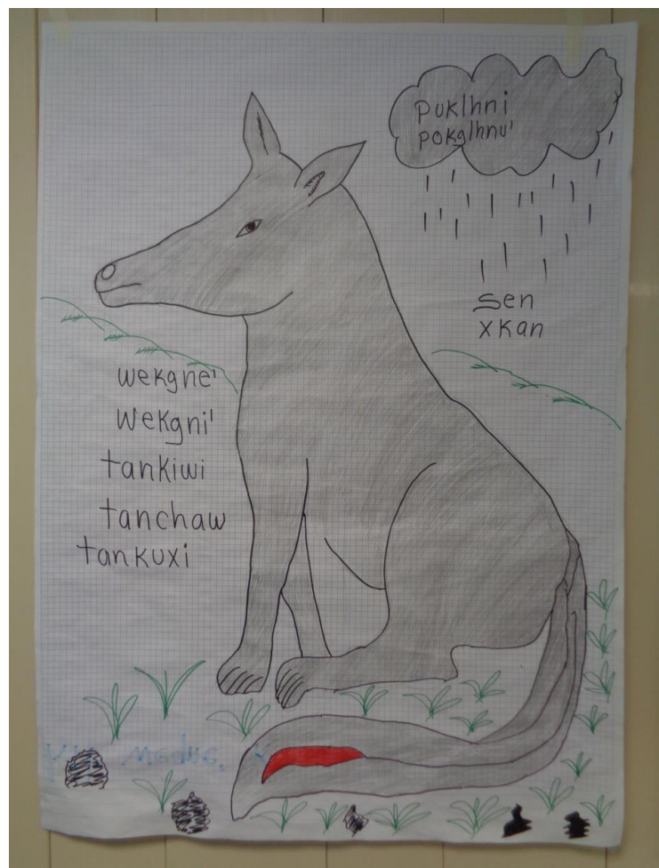
Fig. 3 Pautas pedagógicas (contenidas en la ilustración)