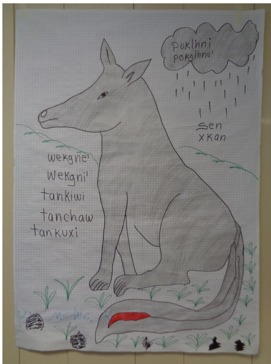
Fig. 1 Ilustración Wan wekgni'