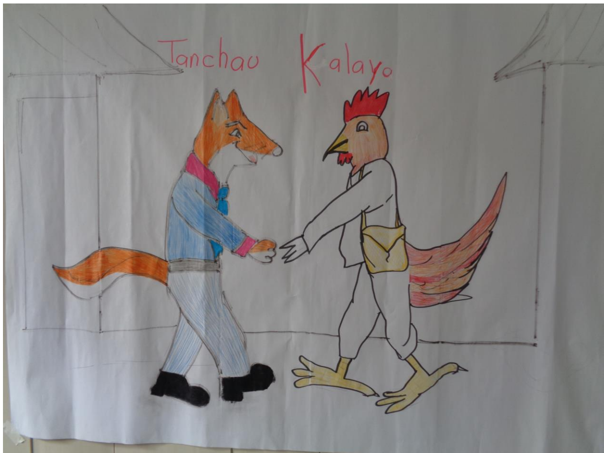
Fig. 1 Diálogo de animales: Tanchau & Kalayo