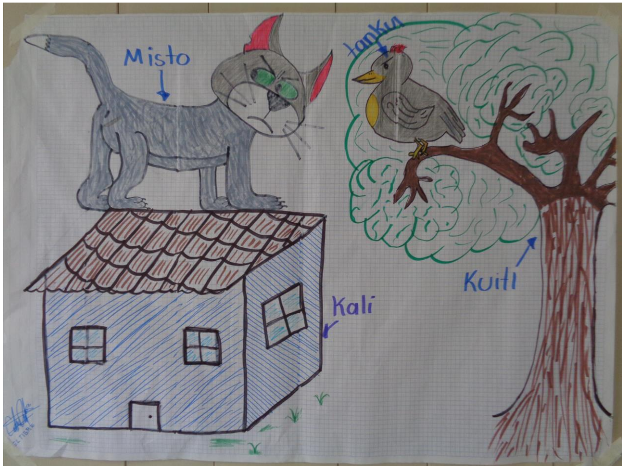
Fig. 1 Diálogo de Animales Misto & Tankui