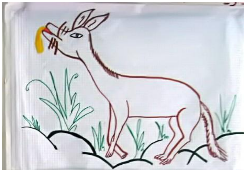
fig. 3. Fig. Representación visual del coyote.

Kintea jñoo tintsubá ko knntea naxí mi iuun nkaye cheankinijiin xki jiun bitjui binchitsee ni xi chinéa ko chííye, t'son juni chine xanta ko najiin tse xuta kjaan ma nkía nchjia nea chii, tsee banka tijinkiná mi saku ñaa.