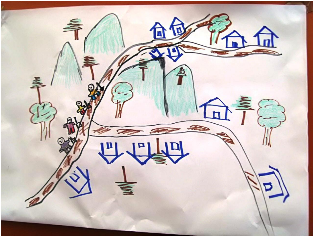
Fig. 1 Representación de “una comunidad donde todas las personas se ayudan mutuamente en el trabajo”.