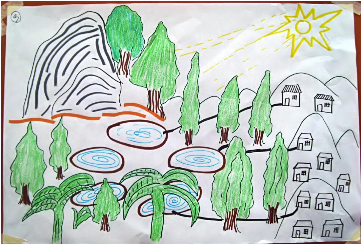
Fig. 1 “Las comunidades y las plantas” o “Piedra frente al sol” (nombre de la comunidad donde trabaja Ninfa Salinas)