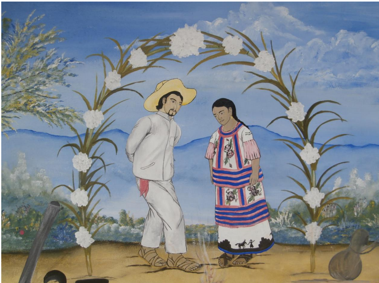
Fig. 1 Fragmento de pintura mural en las instalaciones de la escuela preescolar Naxo Café.

Archivo de origen: AlMaz_Huautla_Taller_5_10_2012_Gram_Verbos Video: AlMaz_Huautla_Taller_Gram_7.MTS Audio: AlMaz_Huautla_Taller_Gram_7 Mesa de trabajo: Gramática Verbos Equipo: 6 Autores: Profesores de la CMPIO (Plan Piloto) Fecha: Octubre 05, 2012 Lugar: Preescolar Naxo Café, Huautla de Jiménez, Oaxaca, México Lengua: Mazateco de Huautla de Jiménez, Oaxaca, México Facilitador: Jean-Léo Léonard Compilador: Karla Janiré Avilés González