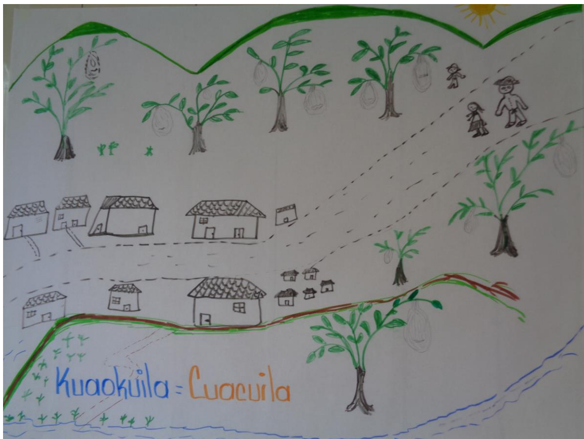
Fig. 1 Ilustración Fundación de comunidades Kuakuila