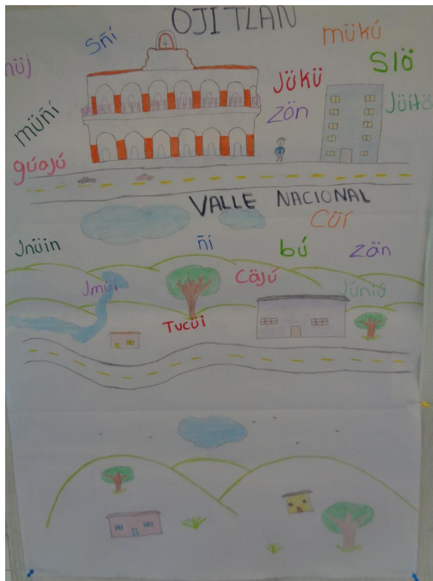
Fig. 1 Representación espacial de las Isoglosas y variantes chinantecas de Valle Nacional y de Ojitlán, originarias de Oaxaca y asentadas recientemente en el Valle de Uxpanapan (Veracruz).

Compiladora: Karla Janiré Avilés González