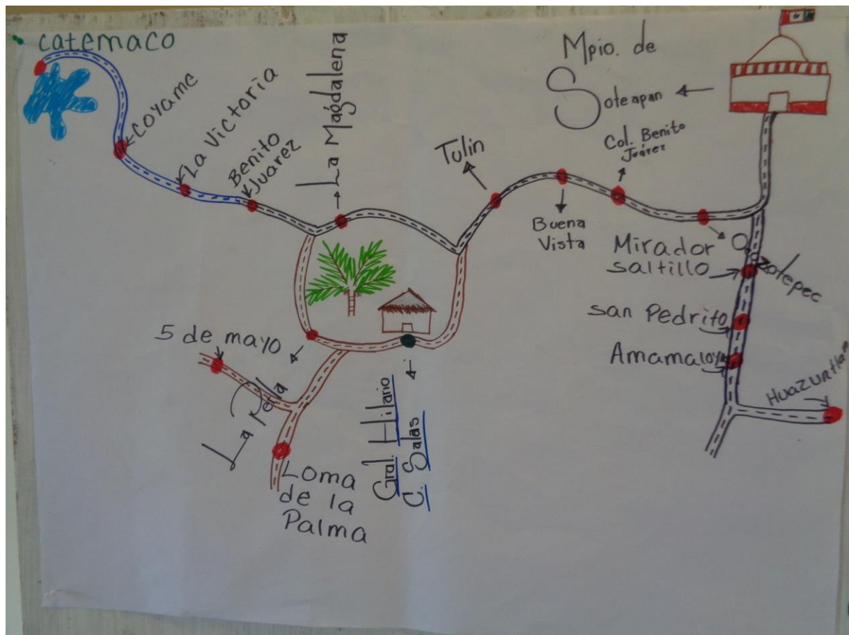
Fig. 1 Isoglosas y variantes popoluca de Hilario C. Salas (Municipio de Soteapan, Veracruz).