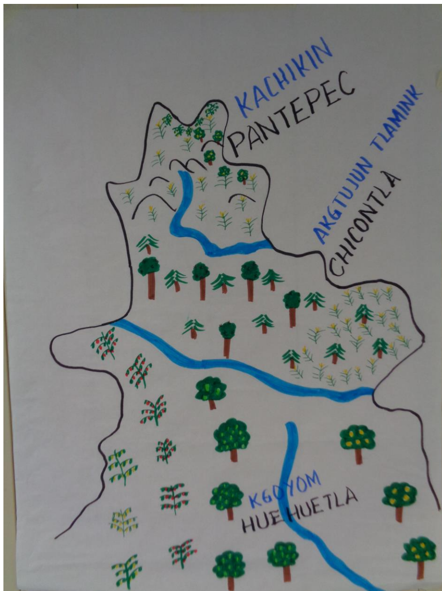
Fig. 1 Mapa ecolingüístico de las tres variantes totonacas analizadas

Compiladora: Karla Janiré Avilés González