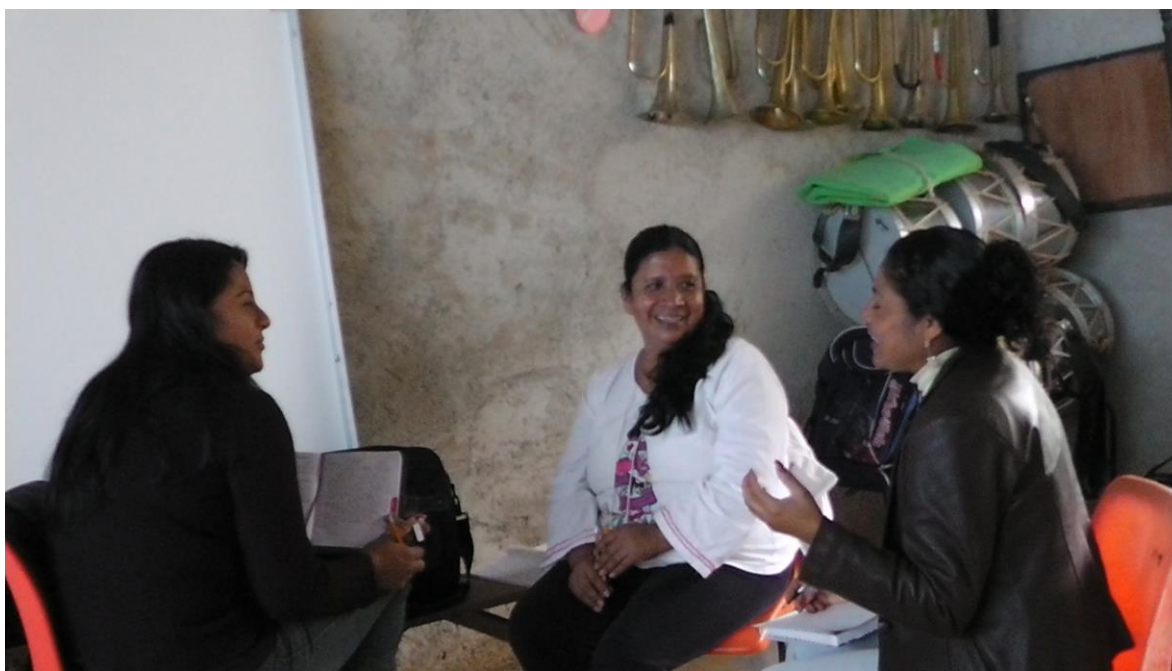
Fig. 2 Autoras: Educadoras de la zona escolar 155 y 156.