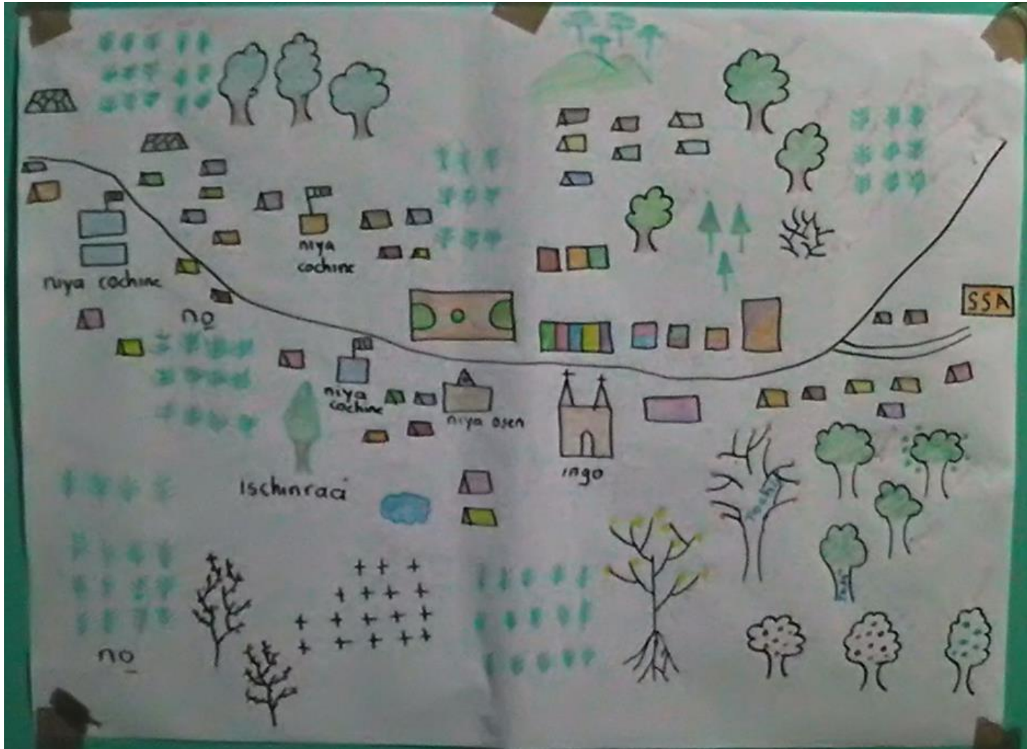
Fig. 2 San Jerónimo Tecoaatl "Je naxinanda Naxii"