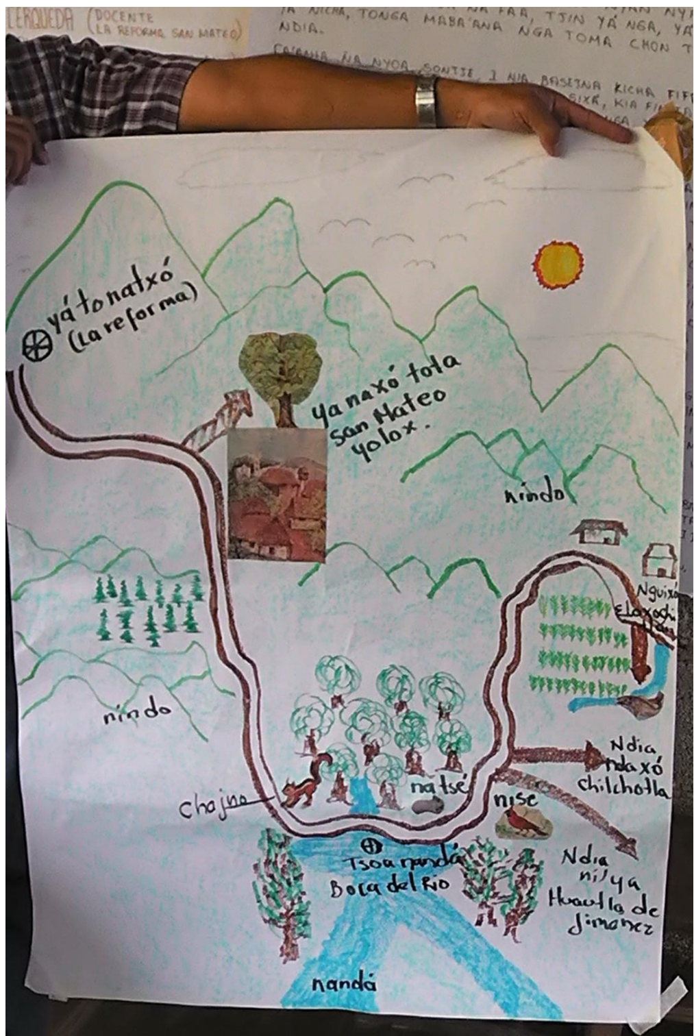
Fig. 3 Mapa I cho'on naxinanda ña xixá