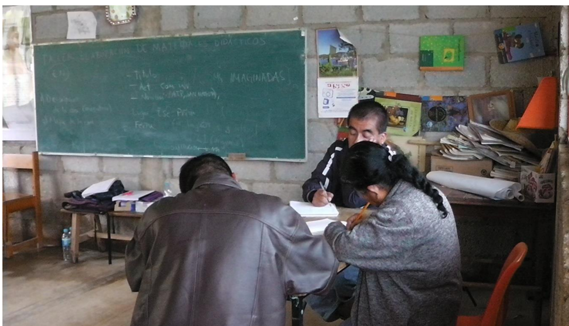
Fig. 1 Autores