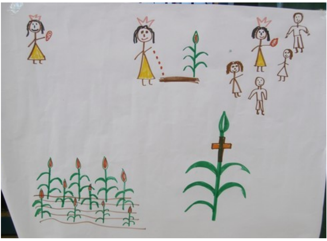
Fig. 4 Ninu kuoó (ilustración)