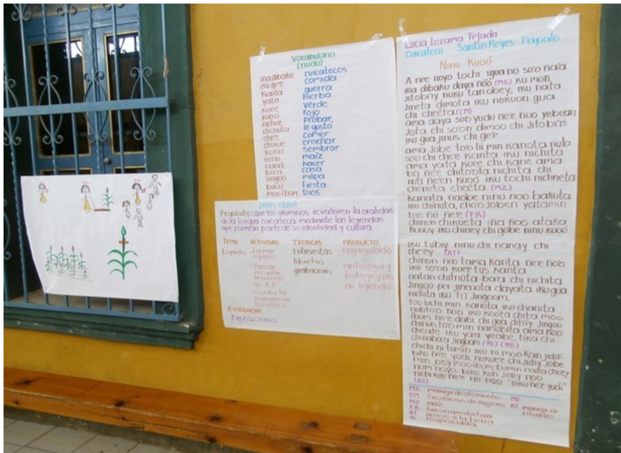
Fig. 1 Conjunto de actividades de la narración Ninu Kuoó « Maíz rojo ».