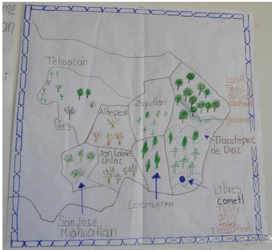
Fig. 2 Representación geolingüística de las variedades nahuas de Tlacotepec, Libres, San J. Miahuatlán, San Gabriel Chilac y Altepeixi (Puebla, México).