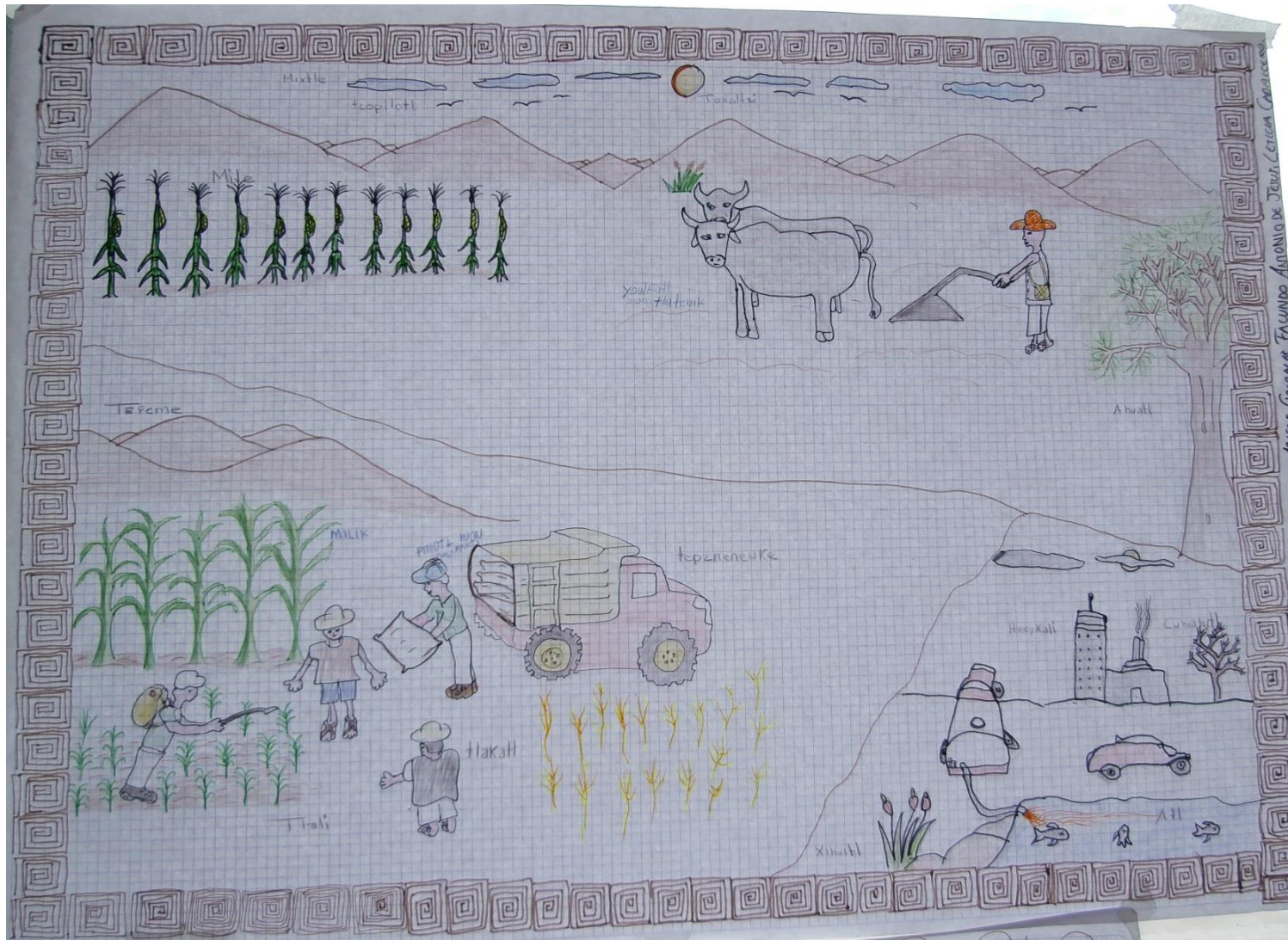
Fig. 2 Tlamantle Tlatokilistle (imagen)