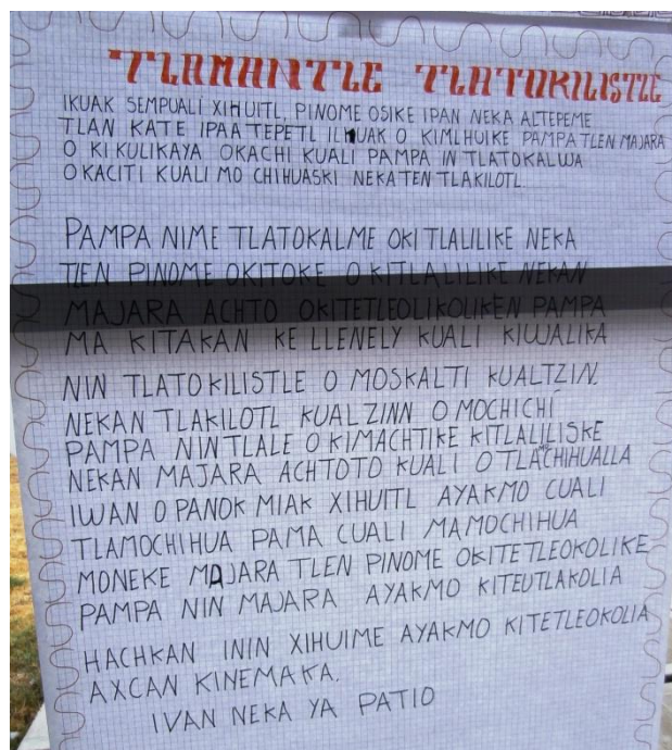
Fig. 1 Tlamantle Tlatokilistle (texto)