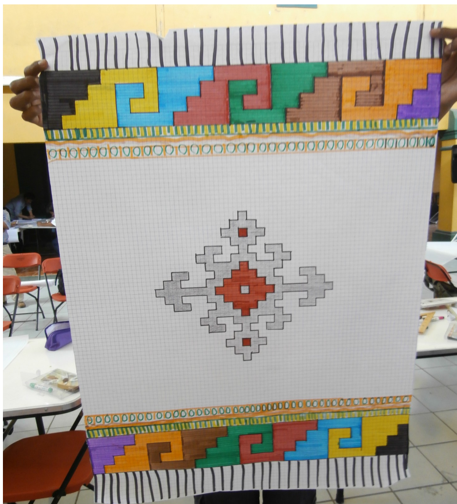
Fig. 1 Tejido tradicional zapoteco Làdy

Compiladora: Karla Janiré Avilés González