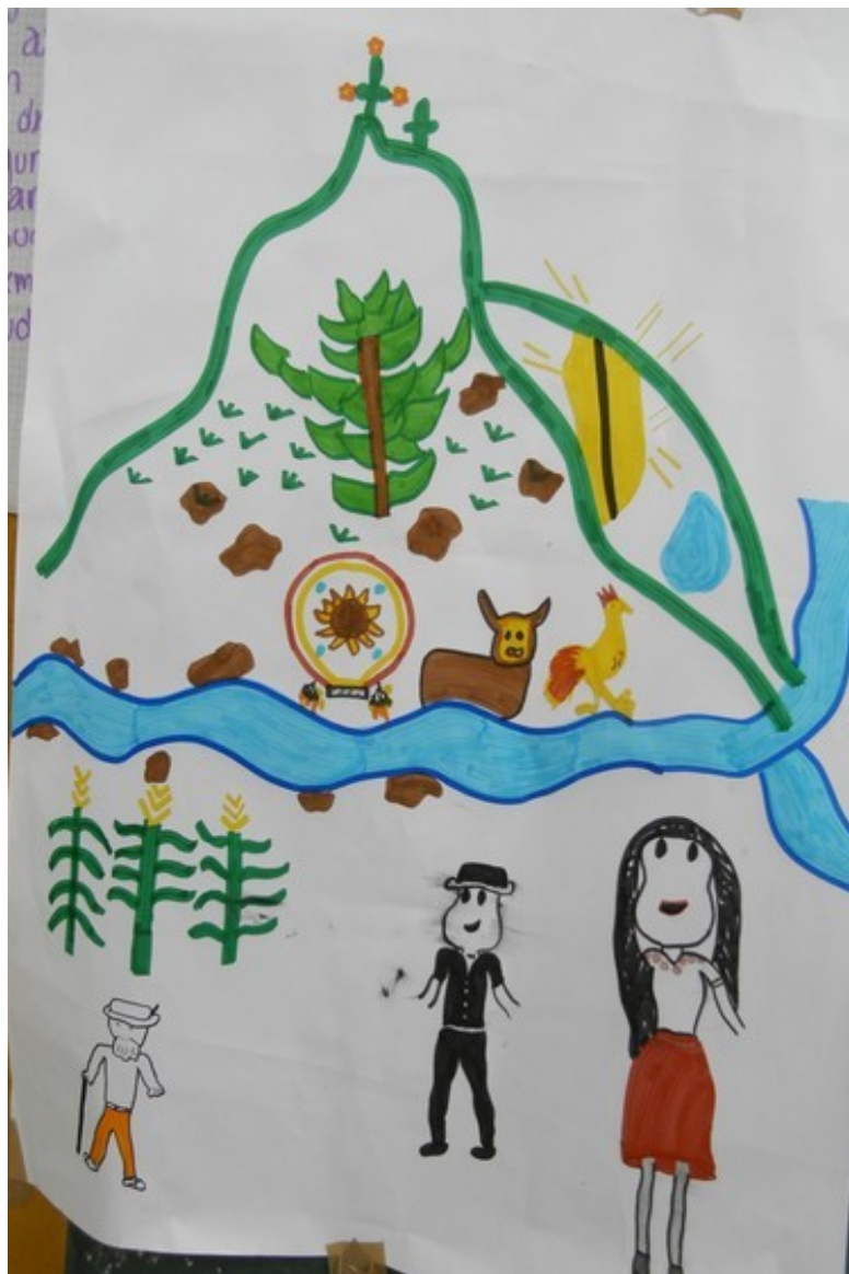
fig. 1 Ilustración de la actividad Lyo San(ch)tx