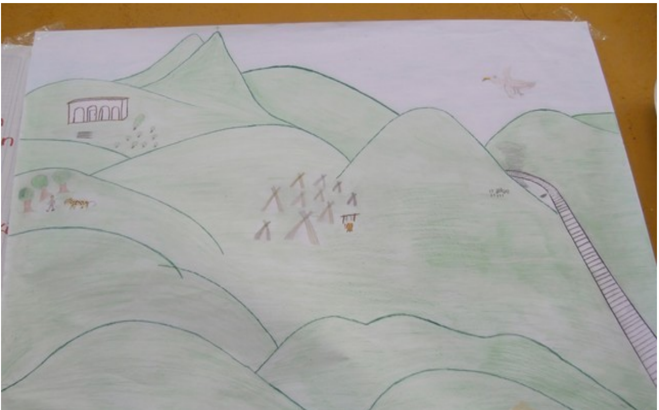
Fig. 1 XTabl Crecensio

Compiladora: Karla Janiré Avilés González